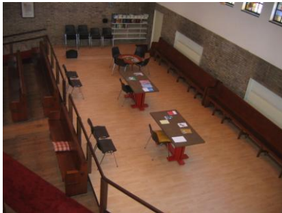
Aparte ruimte in de zaal rechts