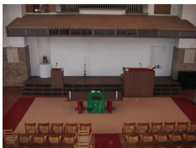
Grote ruimte voor in de zaal