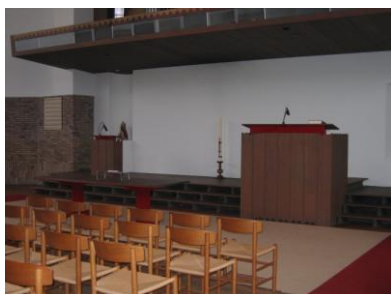
Groot en Klein spreekgestoelte