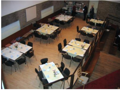
Royale koffiehoek links