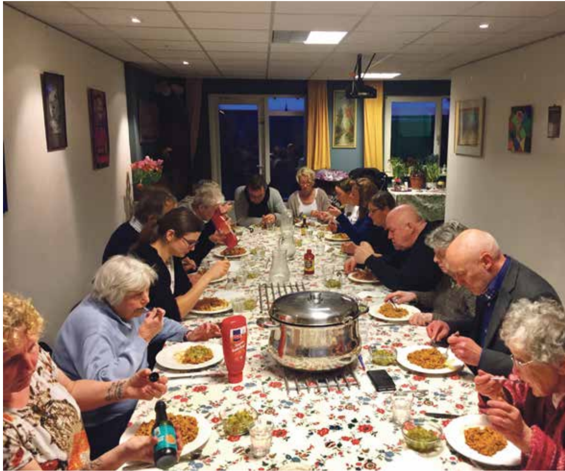
* Maaltijd voor buurtbewoners in de Roobolkapel op Zuilen.

* Het logo van de Protestantse Diaconie Utrecht.