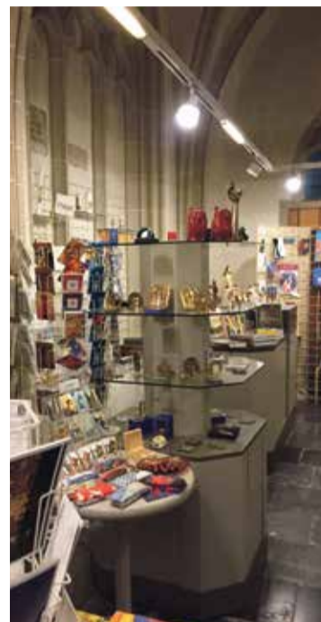
* Domcafé en Domshop: plekken waar vrijwilligers en bezoekers zich thuis voelen.

vrijwilligers een aantal activiteiten georganiseerd en is er een jaarlijkse dag uit met elkaar.