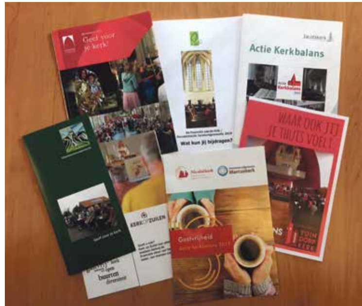
* De Kerkbalansfolders van de Utrechtse wijkgemeenten, een waaier van vormen en kleuren.

'Ik heb de zondagse kerkdiensten nodig om geprikkeld en geïnspireerd te worden in het geloven. In de Kerk op Zuilen word ik altijd door minstens één element geraakt. Dit kan bijvoorbeeld door een mooi lied, een verrassende interpretatie van de organist of de aandacht en zorg waarmee een kind de kaars aansteekt of meedraagt naar de kinderdienst. Zo blijf ik zoeken naar de sporen van de barmhartigheid van God in onze wereld.'