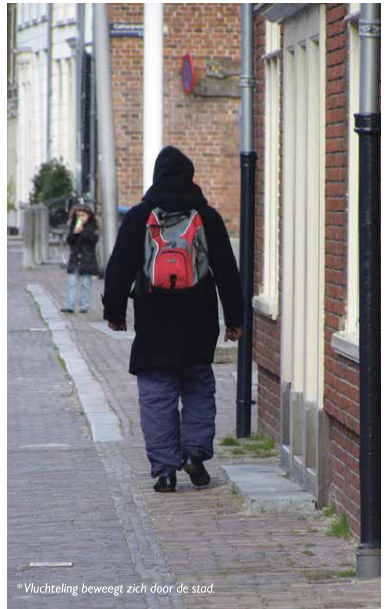
*Vluchteling beweegt zich door de stad.

Onderdeel van de afspraken rond de LVV is dat De Toevlucht de ruimte houdt om schrijnende gevallen op te vangen. Zo doende kunnen we invulling blijven geven aan ons motto "Er behoren geen mensen op straat te slapen". Voorlopig zal De Toevlucht daar-