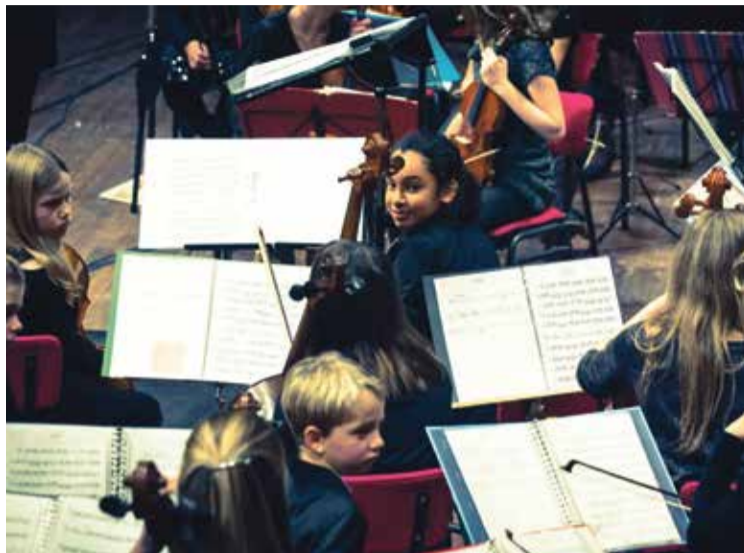
* Het Domstad Juniororkest.